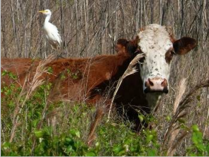
Bubulcus ibis : Ardeidae